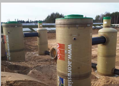
Индустриальный парк "Великий камень" "Оборудование для очистки поверхностного стока в составе ЛОС накопительного типа с самым большим в мире безбетонным аккумулирующим резервуаром АСО StormBrixx, Минск, Республика Беларусь